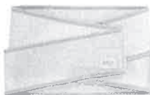
アスリート向け『スポーツやりながらタイプ』 価格 9,975円

治療院やリフレッシュの各店舗で行われている生ゴム使用のテンション極強のモデル<連続使用可能時間60分> カラー:白 素材:天然ゴム