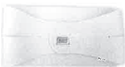
プロ仕様『自宅で整体タイプ』 価格 9,975円

1986年に千葉県成田市に「山本鍼灸整骨院」を開業。その後、口コミで広がる『ヤマト式整体』を手軽に受けもらうため、全国各地に整体・リラクゼーションサロン「リフレッシュ」をオープンさせる。現在も日本オリンピック委員会強化スタッフ(医・科学)/オリンピック体操女子チーム専属スタッフとして活躍中であり、また各スポーツ界の一流アスリートや、様々な業界のプロから絶大なる信頼を受けるスポーツトレーナー、リフレッシュリラクゼーションスクール学院長