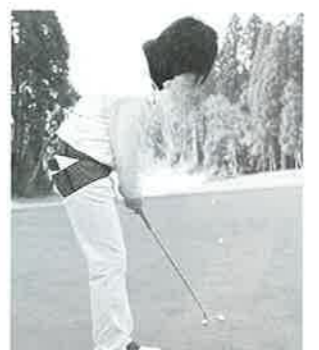
サンプリングですが、かわいい花柄がお気に入り。キャディ仲間におすすめしています