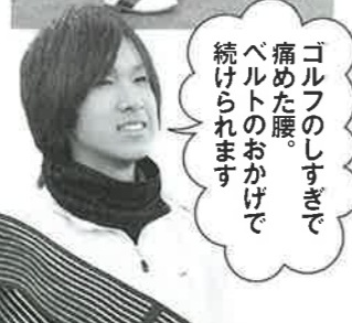
ゴルフのしすぎで 痛めた腰。 ベルトのおかげで 続けられます