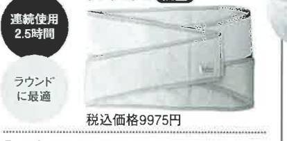
「スポーツ、仕事をしながら」(スタンダードタイプ)腰に不安があるけれどスポーツをしたい、仕事をしなければならない人に。