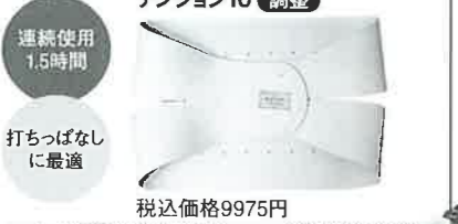
「スポーツ、仕事をしながら」(デラックスタイプ)ズレやゆがみを「調整」。腰に不安があるけれどスポーツをしたい、仕事をしなければならない人に。

「プロ仕様 自宅でセルフ調整」ズレやゆがみを「調整」。腰に不安があるけど忙しくてなかなか治療院に行けない人に。