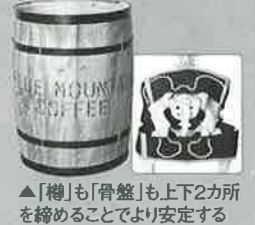
▲「樽」も「骨盤」も上下2カ所を締めることでより安定する

樽の「たが」のように上下2本のベルトで締める。ワインや日本酒を保存する「樽」。上下に巻いてある「たが」をたたいたり、揺らしたりしながら締め、樽の強度を高めていく。この原理を「骨盤」に応用したのが「樽理論」による「骨盤ストレッチベルト」。骨盤の上下2カ所を締め、歩いたりエクササイズすることで無理なくズレやゆがみを整える。