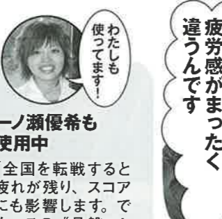
わたしも使っています!