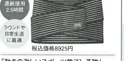
「動きの激しいスポーツ兼ズレ予防」骨盤のズレやゆがみ予防。「調整」タイプで整えたあとの使用に。