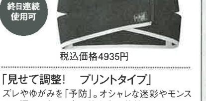
「見せて調整! プリントタイプ」ズレやゆがみを「予防」。オシャレな迷彩やモンステラ柄はラウンド中や仕事での装着にオススメ。