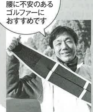
腰に不安のあるゴルファーにおすすめです

慢性的に腰に痛みがある、だけど大好きなゴルフも楽しみたい。そんなゴルファーの間で話題になっているベルトがある。数ある腰痛対策ベルトとどう違うのか？人気の理由を探ってみた。