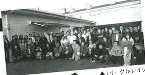
▲「イーグルレイクGC」で行われた、プライベートコンペにお邪魔。ベルト愛用者に取材しました